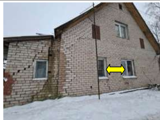
Dzīvokļa Nr.4 logi