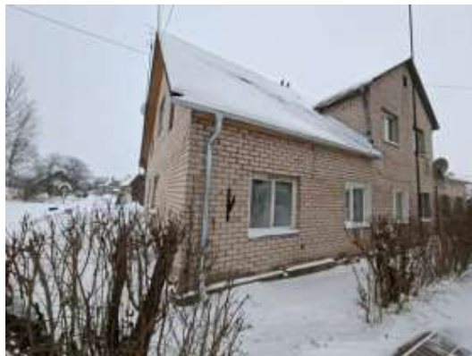
Dzīvojamā māja Stacijas ielā 66