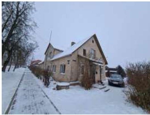
Dzīvojamā māja Stacijas ielā 66