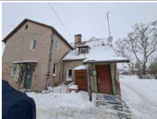
Dzīvokļa Nr.4 ieejas durvis