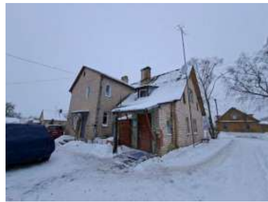
Dzīvojamā māja Stacijas ielā 66