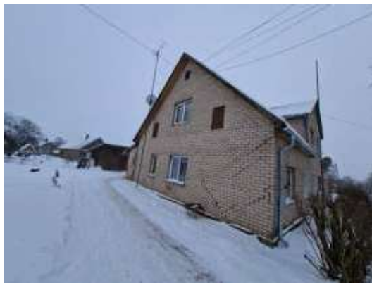
Dzīvojamā māja Stacijas ielā 66