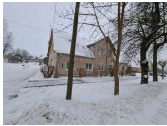
Dzīvojamā māja Stacijas ielā 66